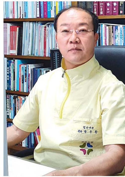
지에 글을 올리거나, 의료진과 연계할 수 있도록 상담을 요청해 주세요. /유연재 기자 yjyou@

“센터가 활성화 돼서 코로나19로 고통을 겪는 국민들, 모두의 건강을 되찾았으면 좋겠습니다. 코로나19 후유증이 의심되면 언제든지 센터 홈페이지