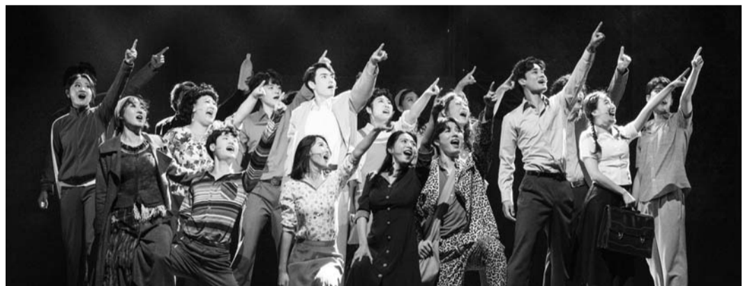
뮤지컬 '광주' 배우들이 출연하는 '5·18 40주년 음악회'가 오는 16일 서울 여의도 KBS홀에서 열린다.