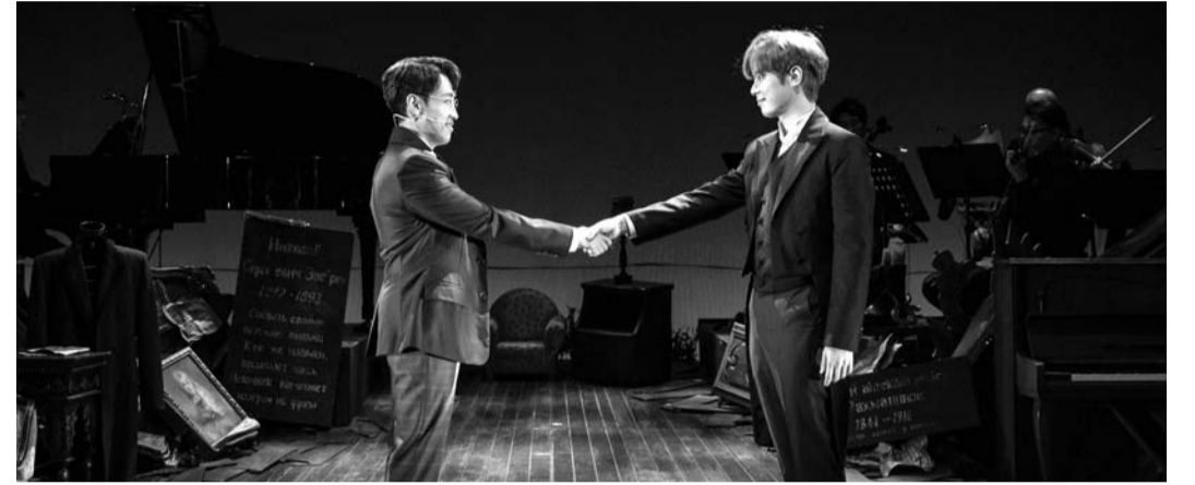
뮤지컬 '라흐마니노프'가 16일 오후 7시30분, 17일 오후 3시 광주문화예술회관 소극장에서 열린다.