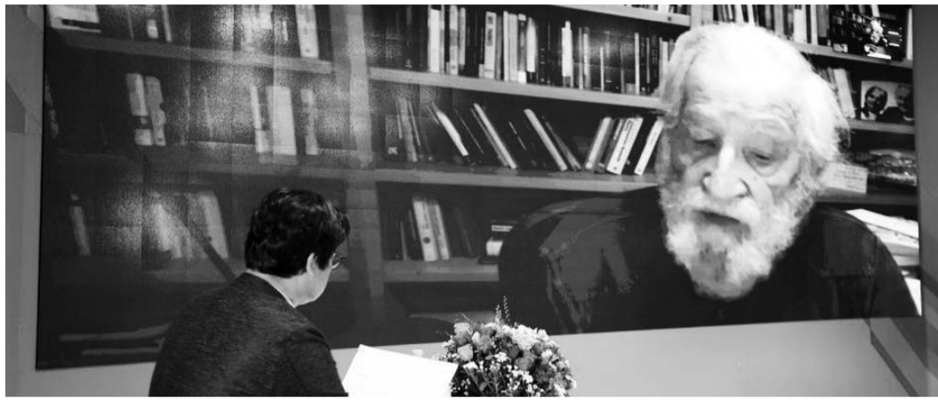
20일 개최될 아시아문화포럼을 앞두고, 노엄 촘스키와 이동연 교수가 사전 화상 대담을 나누는 모습.

구체적인 주제세션은 문명이 전환하고 있는 현재 시대의 모습을 '인류세', '위협사회', '해게모니'라는 주요 키워드 3가지로 집약한다. 홍기빈 전