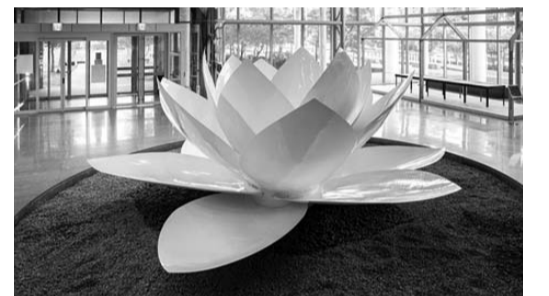
김현수 작 '백련-범문화적 의식'

김 작가는 독일 각지를 거쳐 광주에 도착한 프로젝트 '백련'이 종교, 문화, 이념을 넘어 평화와 관