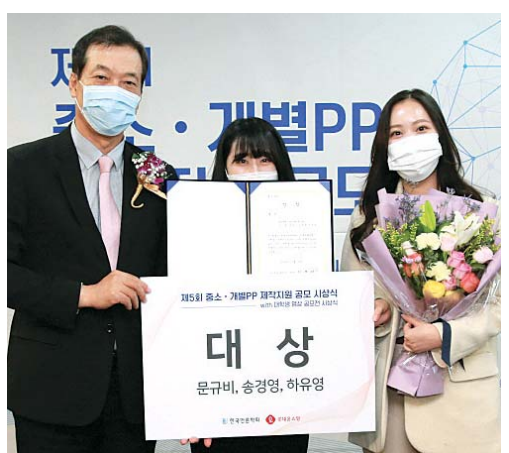
모의 상금이 내걸린 올해는 전국 60개 대학교에서 64개팀이 몰릴 정도로 주목받는 대회로 성장했다.