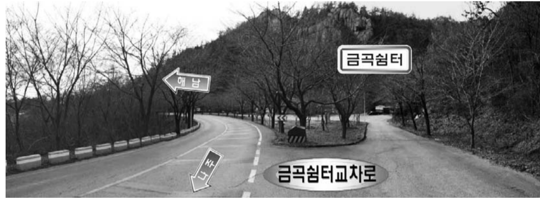
강진 주민들의 숙원사업인 군동면과 작전면을 잇는 까치내재 터널공사 11년만에 착공했다.

지역은 물론 강진읍을 비롯한 까치내재 남쪽지역의 발전에도 크게 기여하게 돼 강진 전체에 활력을