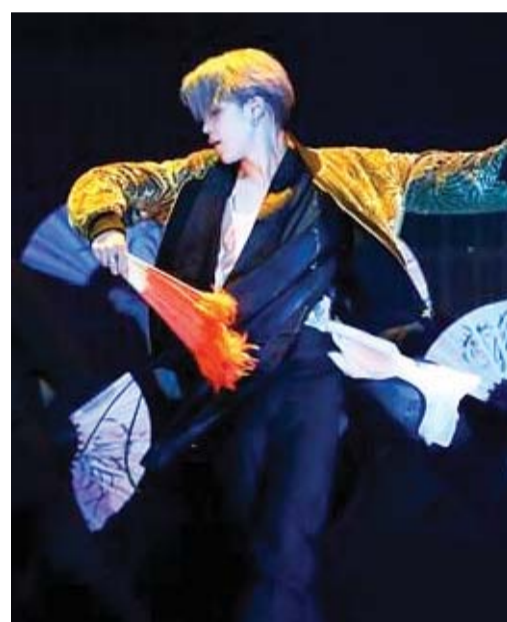
화제가 된 BTS 한복

황 디자이너는 “한복이 전 세계적으로 관심을 받고 있어 무척 뿌듯하다”면서 “궁극적인 목표는 체형과 나이에 관계없이 누구나 즐기는 일상복으