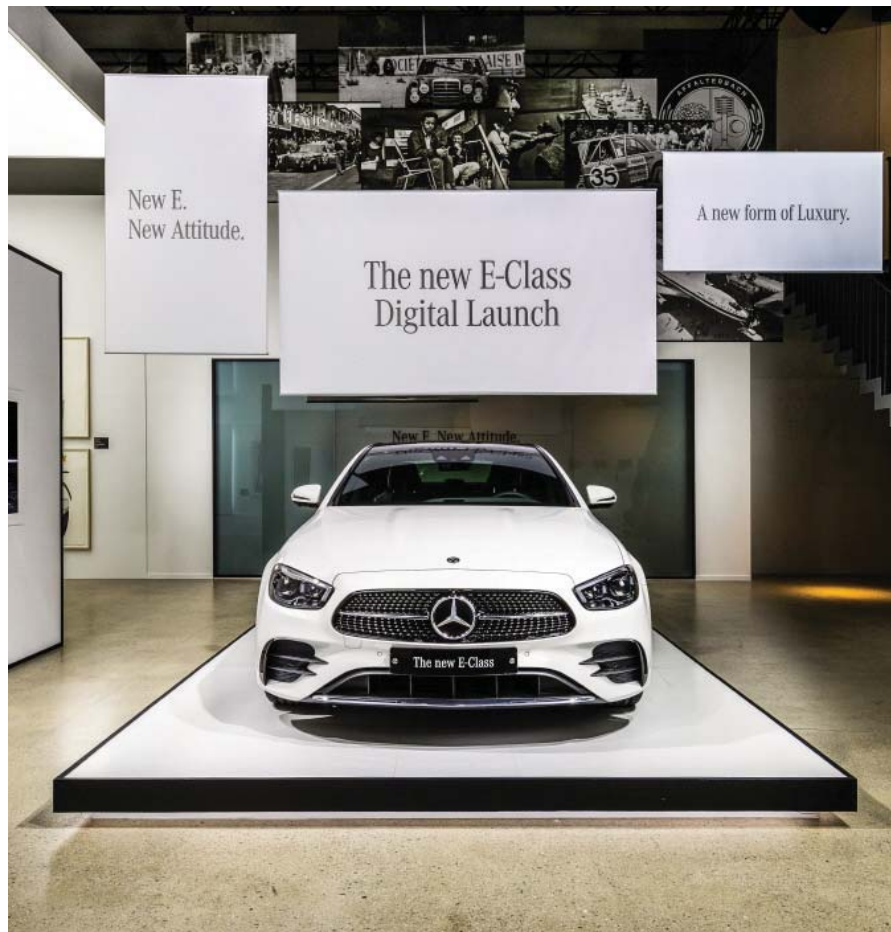
메르세데스-벤츠 코리아가 최근 선보인 10세대 E클래스 부분변경 모델 ‘더 뉴 E-클래스’.

‘E300 4MATIC’·‘E250’ 등 1~3분기 5만3571대 팔려 1억 넘는 외제차 3만929대 판매... 지난해보다 60% 늘어