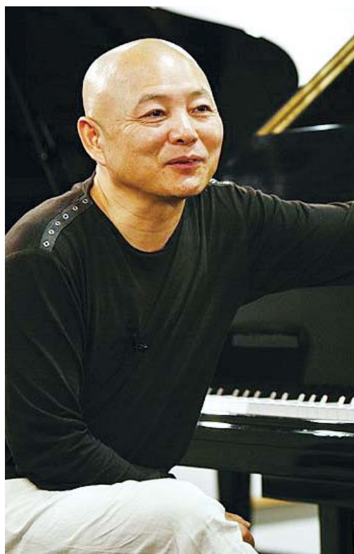
‘빛고을 아리랑’처럼 광주가 얼마나 평화롭고 아름다운 곳인지 알려졌으면 한다는 바람을 전했다.