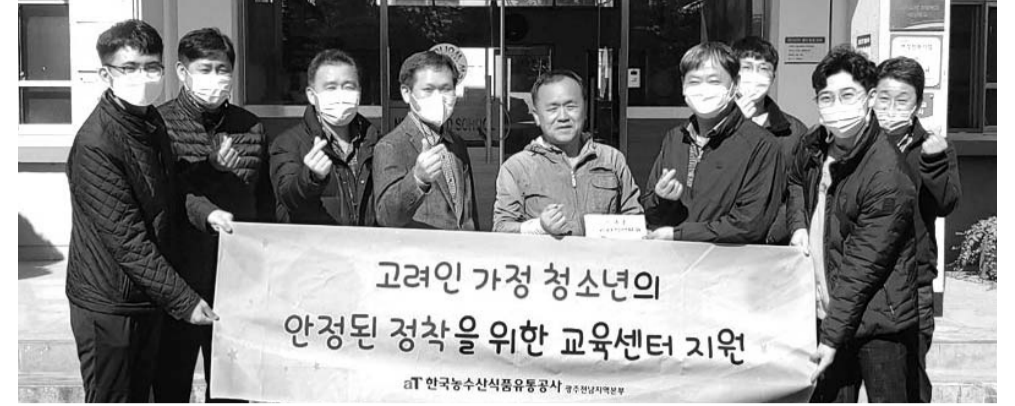
한국농수산식품유통공사(aT) 광주전남지역본부는 지난달 29일 광산구 고려인마을 새날학교를 찾아 기부금을 전달하고 교내 환경정화를 도왔다.