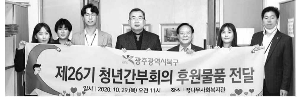
광주시 북구(구청장 문인) 제26기 청년간부회의가 최근 코로나19 여파로 어려운 복지시설에 후원물품을 전달했다. 청년간부회의는 지난달 석고방향제를 직접 제작한 뒤 구 직원에게 판매해 100만원의 성금을 마련하고, 북구에 있는 복지기관을 찾아가 성금으로 구입한 쌀 50포를 전달했다.