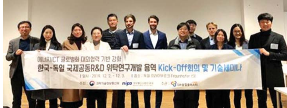
광주전남SW융합클러스터사업단이 지역 내 소프트웨어, 정보통신기술 관련 기업들과 해외 유수의 연구소와 해외 기업과의 공동개발을 지원했다. 선진 기술을 습득해 유럽 시장 발판을 노리기 위한 포석이다. 지난해 12월 열린 해외 연구기관과의 워크숍 장면.