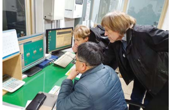
사업단은 국제공동 연구개발을 통한 신재생에너지와 저탄소기술을 이용한 통합 EMS 개발에도 박차를 가하고 있다. 독일 연구기관과 지역기업이 협업하고 있다.