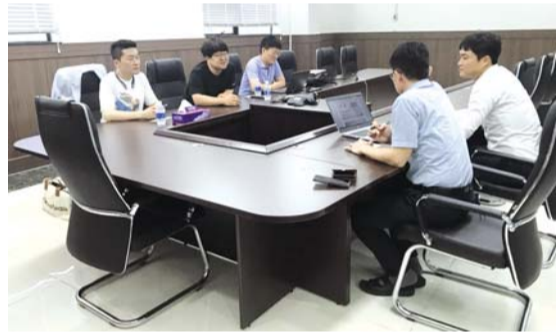
'에너지신산업 SW융합클러스터 육성 사업'을 통해 지원을 받은 지역기업 (주)티에프의 회의 장면.