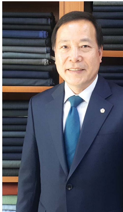
을 비취보라고 권합니다. 자연스럽게 포즈를 취한 채 어떤 색에 어떤 스타일의 옷을 입을지 생각하면 답을 찾을 수 있거든요. 새 옷을 입는다고 모두 멋쟁이는 아니거든요. 자신만의 스타일을 찾고 연출할 수 있다면 이미 멋쟁이나 다름없지요.”