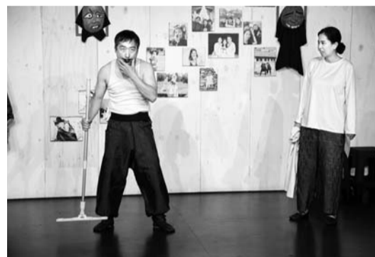
극단 깍지 '지금 이 전성기'

한다. 오는 22일 오후 1시와 4시30분 두 차례 광주아트홀 무대에 올려지며 '영화관에서 불이 났을 때' 등 4개의 상황별 에피소드를 중심으로 펼쳐진다. 현지 소방관의 감수를 받았다.