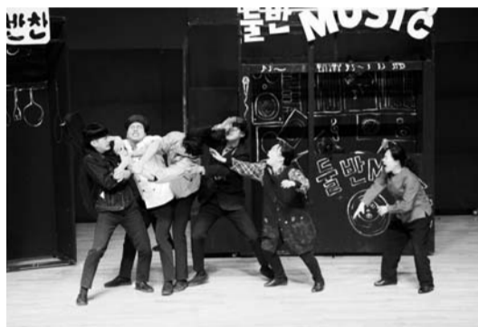
극단 토박이 '5월, 님을 위한 노래 나오라 오바'