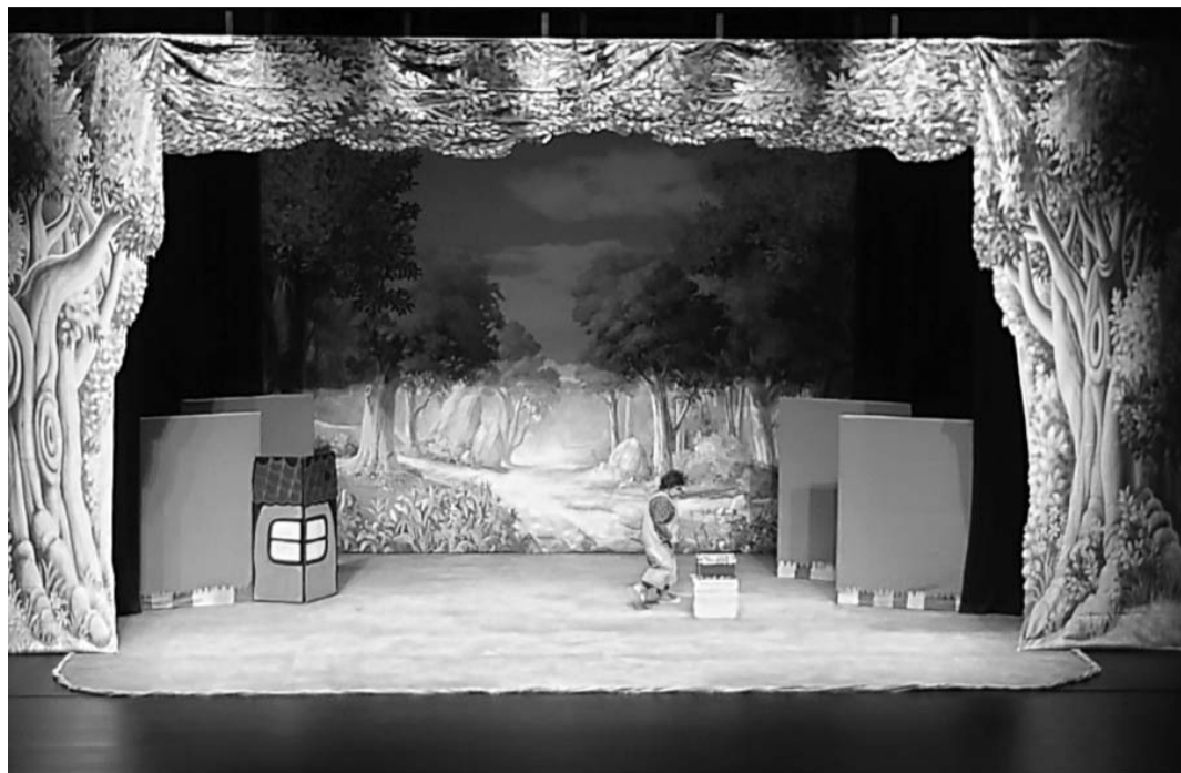
교육극단파랑새 '아름다운 선물'

ACC가 제작한 안전교육 콘텐츠도 관객들을 찾아간다. 판토크림페토리는 대한민국 안전대상 수상작 '출동! 마인소방관'을 들고 이번 축제에 참여