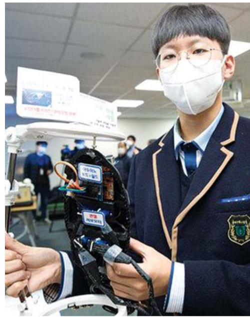
없이 기록하고 있어요. 열심히 공부해서 과학 기술의 발전에 기여하고 싶어요.”