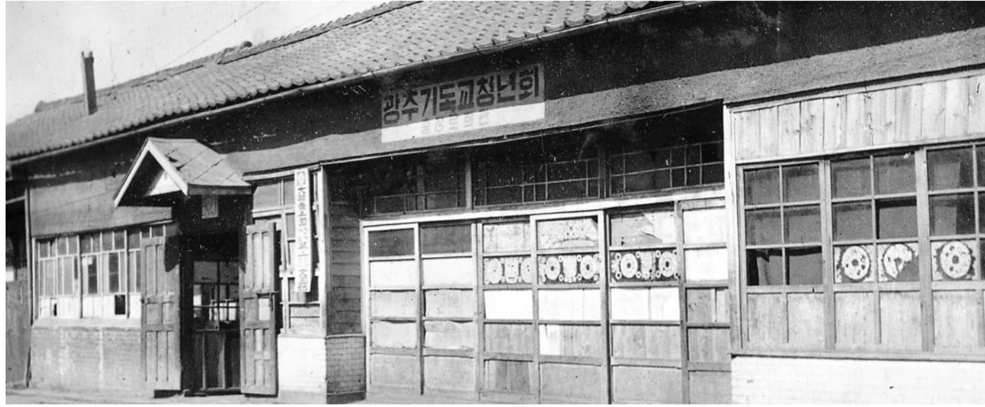
광주기독교청년회(광주YMCA)는 민족운동을 통해 자주독립을 실현한다는 기치 아래 교육, 봉사 등 다양한 사회활동을 전개했다.