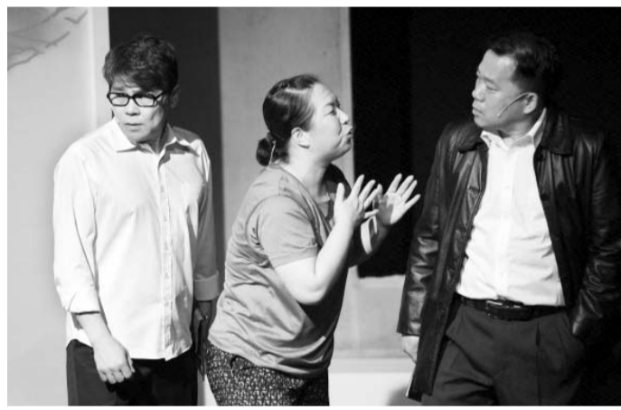
'애꾸눈광대' 공연 모습.

전통음악에 현대적 영상미와 음악을 더하는 무토(MUTO)와 판소리를 새롭게 시도한 포스트엠엔에이치(POST MNH)가 공동 연출, 출연했다. 전석 무료이며 ACC 홈페이지에서 예매 후 관람이 가능하다. /박성현 기자 skypark@kwangju.co.kr