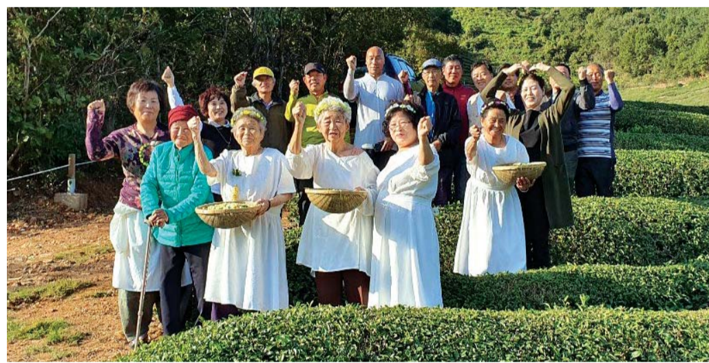
녹차를 수확한 뒤 기념촬영하고 있는 보성 회천면 영천마을 주민들.

담양군 의용소방대는 코로나19 확산 방지와 여름철 태풍피해 복구에 헌신한 공로를 인정받았다. /유연재 기자 yjyou@kwangju.co.kr