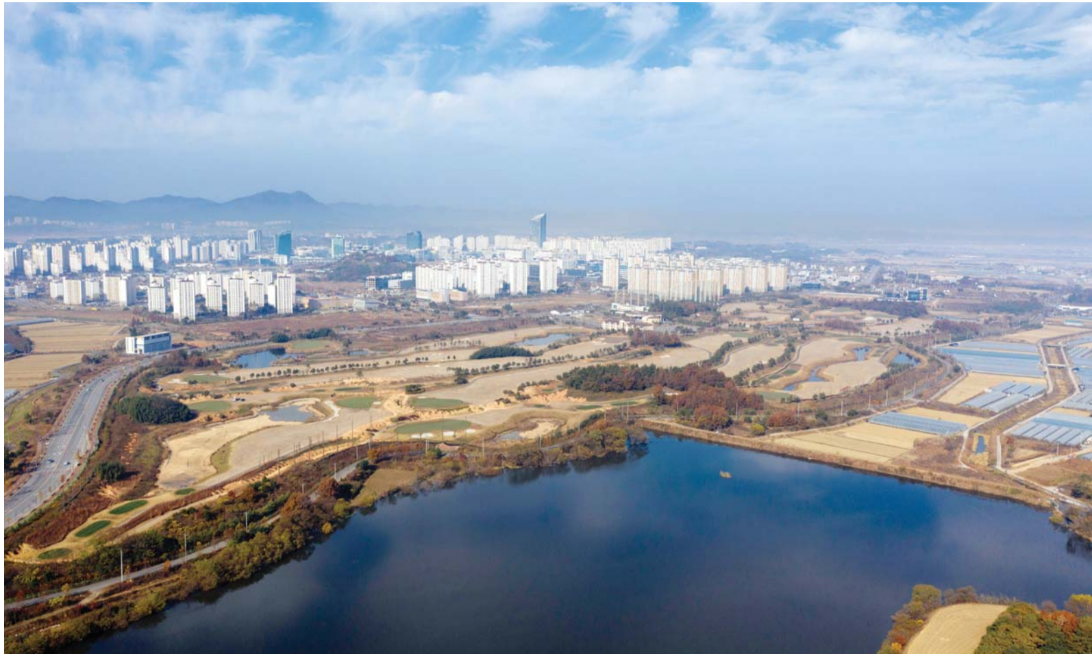
(주)부영주택 측은 골프장 절반기량을 한전공대 부지로 기부하고 남은 땅에 아파트 5000여채를 짓겠다고, 나주시에 토지 용도변경을 요청했다. 한전공대와 아파트가 들어설 나주 및 기암혁신도시 부영골프장 전경.

한전공대 부지 골프장 기증 이후 녹지 없는 고층 아파트 숲 건설 도시계획 짜맞추듯 변경 착수 "주거의 질 외면" 거센 비난 목소리