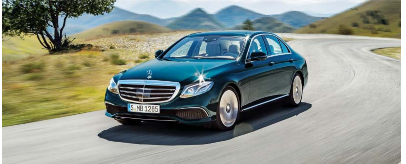
올해 1~10월 국내 수입차 누적 판매 1위를 기록한 메르세데스-벤츠 E300 4MATIC.

7월 들어서는 개소세가 상향되면서 1만9778대로 잠시 주춤했다가 8월 다시 판매가 늘기 시작해