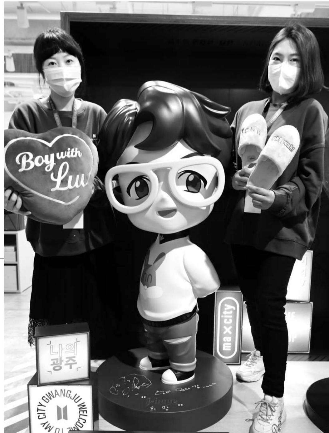
롯데백화점 광주점 직원들이 내년 2월까지 매장 9층에서 운영되는 '방탄소년단'(BTS) 공식 팝업스토어에서 기념품을 선보이고 있다.