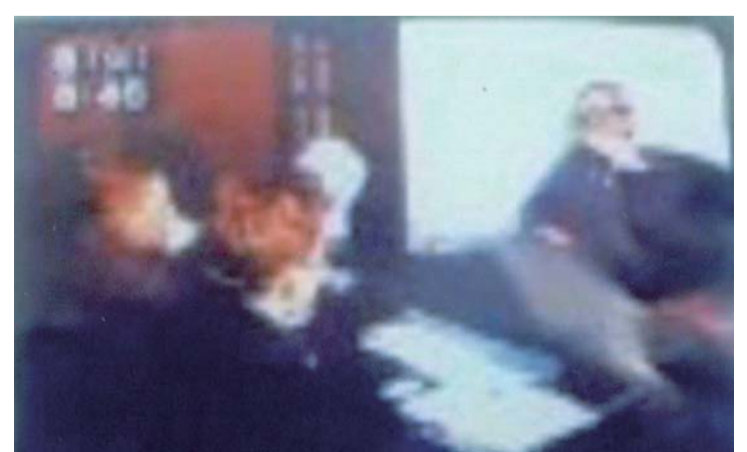
외국인과 교포가 많이 찾는 白山 선생 (MBC TV 방영) *코로나로 인해서 전국민 비대면 작명을 환영 합니다.