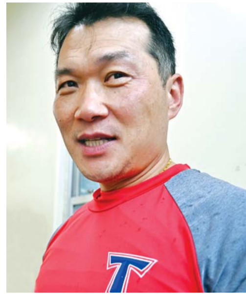
좋았던 것 유지하고 경기력에 더 도움이 될 수 있도록 최선을 다하겠다”고 말했다.