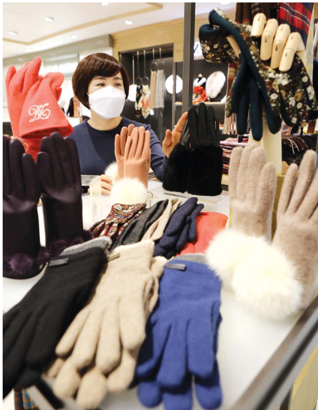
온기를 전하세요 6일 롯데백화점 광주점 직원이 4층 패션매장에서 가죽·모직·털 등 다양한 소재로 만든 장갑을 선보이고 있다.

로와 제2순환도로 등 주변지역 이동도 수월하다. 또 단지 북쪽에 위치한 쌍암공원과 동쪽에 첨단근린공원, 서쪽에 양암공원이 있으며, 영산강이 가까이 자연환경을 누릴 수 있다. 일부 세대에서는 쌍암공원과 영산강 조망도 가능하다. 이밖에 첨단초, 정암초, 비아중, 송덕고를 도보로 통학할 수 있으며 미산초, 월계중, 광주과학고 등이 가깝다. 광주과학기술원, 조선대 첨단산학캠퍼스, 광주외국인학교, 국립광주과학관 등도 인근에 있다. 특히 남측향 위주 배치로 채광·통풍이 용이하며, 판상형과 탑상형 등 다양한 구조를 선보이며 입주민들의 선택의 폭을 넓혔고, 주택형별 위크인 현관창고와 드레스룸, 알파룸, 서재 등 넉넉한 수납공간도 갖췄다. 피트니스센터, 실내골프연습장 등 커뮤니티 시설도 들어선다. 이밖에 힐스테이트 IoT 서비스 하이오티(Hi-oT) 기술을 적용, 스마트폰으로 조명, 가스, 난방 등 빌트인 기기와 IoT 가전을 제어할 수 있고, 스마트폰 키 시스템으로 공동현관자동문 무선인증 출입도 가능하다. 분양 문의 1899-1686. /박기용 기자 pboxer@