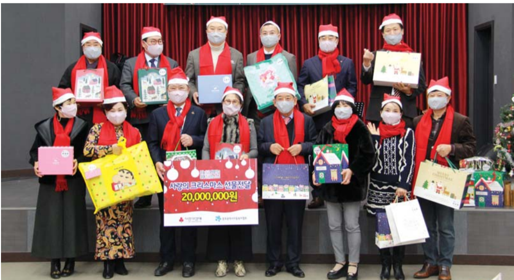
광주 아너 소사이어티 회원들이 최근 산타로 변신해 무등육아원(광주 동구)에서 아이들을 위한 선물 꾸러미를 전달했다.