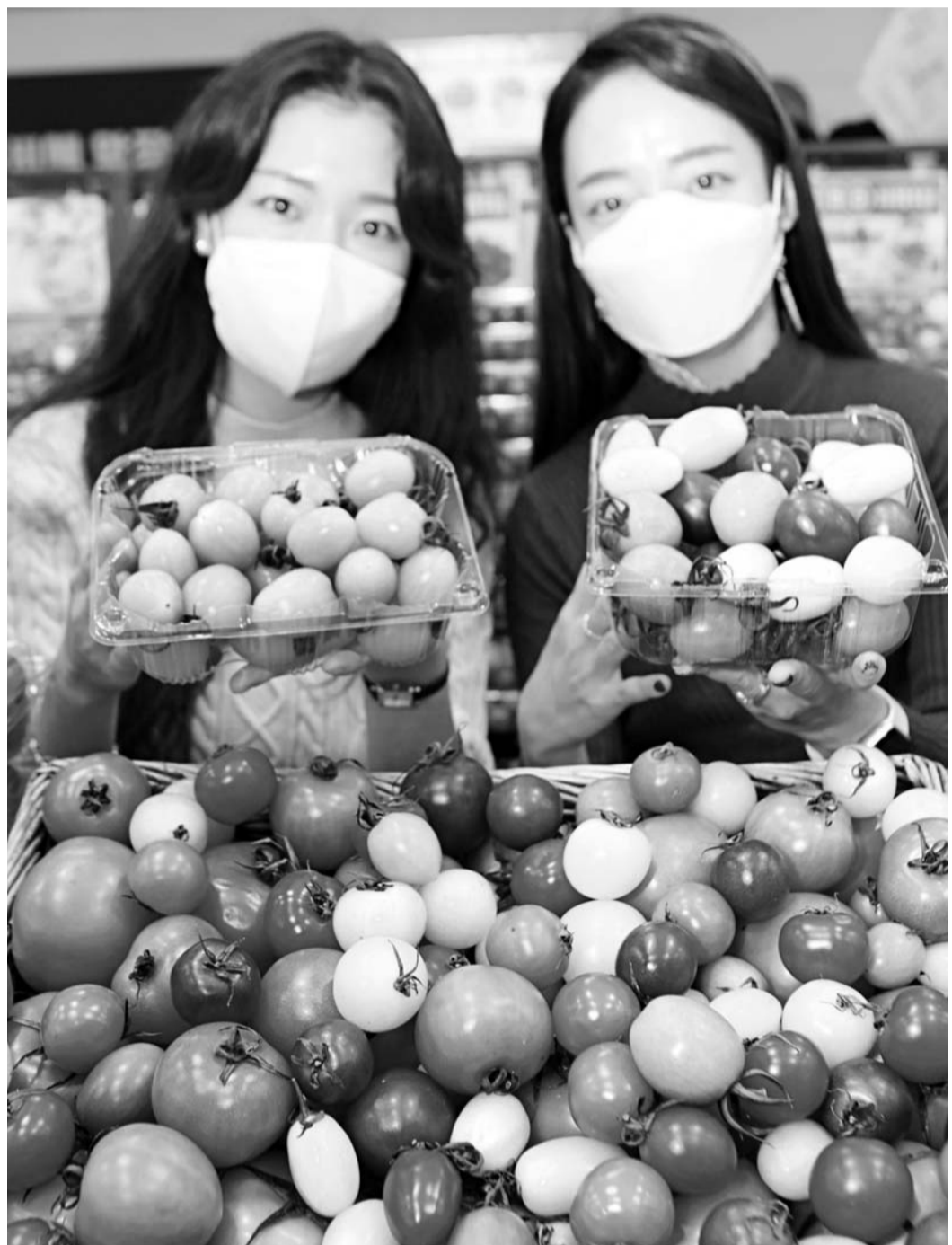
"토마토 취향따라 골라 먹어요" 롯데마트 모델들이 생김새와 색상·맛이 각기 다른 토마토 6종을 선보이고 있다. 광주·전남 9곳을 포함한 전국 롯데마트는 오는 6일까지 토마토를 2팩 이상 구매하면 1팩당 1000원을 할인해준다.

롯데아울렛 수완점은 오는 6일까지 '전남도 농수특산물 상생장터'가 1층 특별매장에서 열린다고 3일 밝혔다. 롯데아울렛 수완점은 지난해 8월 전남도와 '농수특산물 판로 확대 업무 협약'을 맺은 뒤 지역 농산물 소비촉진을 위한 직매장을 열어 오고 있다. 6일까지 일주일 동안 전남 22개 시군 우수 생산자가 농수산물을 최대 30% 저렴한 가격에 내놓는다. 대표 상품으로 영랑 법성포 참굴비 2호(1.2kg) 1만4000원, 해남 고구마(3kg) 1만원, 구례 표고버섯(1kg) 1만6000원, 여수 돌산 갯감치(100g) 1000원, 무안 지주식 곱창돌김(50매) 9000원, 진도 박대(3마리) 2만원 등이 있다. /백희준 기자 bhj@kwangju.co.kr