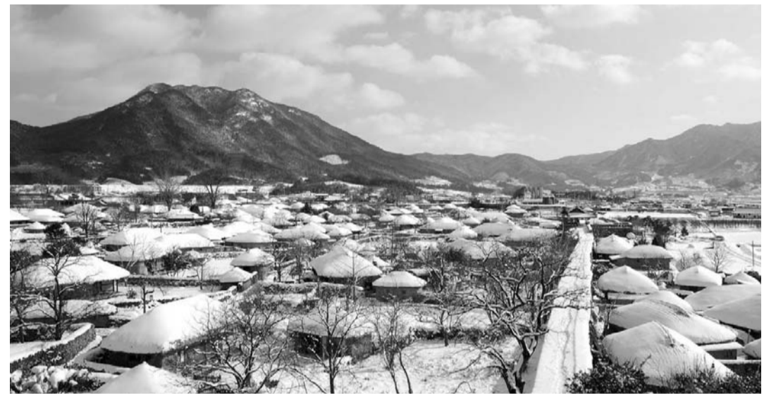
순천 대표 관광지 ‘낙안읍성’의 겨울 풍경.

구례군 관계자는 “도시 상권이 급속히 쇠퇴하는데 여름 집중호우로 5일시장 일대 피해로 주민들의 고통이 가중됐다”며 “도시재생을 통해 수해로 어려움을 겪고 있는 상인과 주민들이 다시 활력을 찾기를 바란다”고 말했다. /구례=이진택 기자 lit@