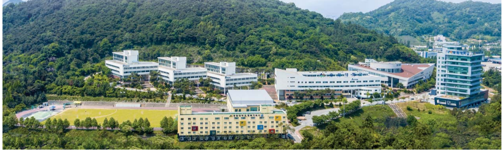
매년 70% 이상의 높은 취업률을 기록하는 송원대는 실력뿐만 아니라 인성을 강조한 교육으로도 정평이 나 있다.