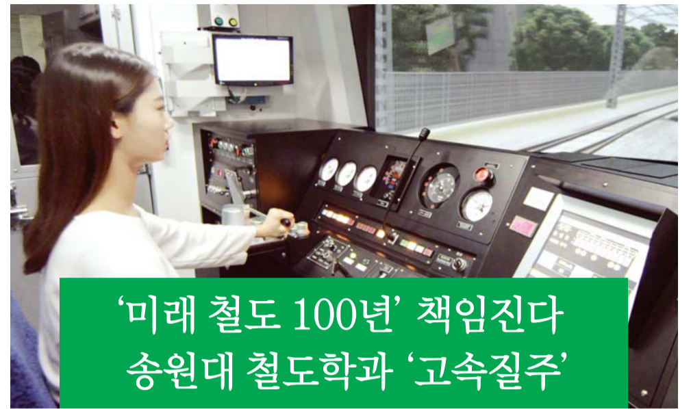
'미래 철도 100년' 책임진다 송원대 철도학과 '고속질주'

송원대는 특히 기존의 '지역사회와 함께 4차산업'을 선도하는 작지만 강한 대학'에서 '열정교육으로 꿈이 성장하는 행복한 대학'으로 대학 비전을 재설정하고 Better(보다 더 나은), coExistent(상생공존체 학생지원), Support(산학진화형 대학), Teamwork(효율적 경영) BEST 중장기발전전략을 재정비했다. /채희중 기자 chae@