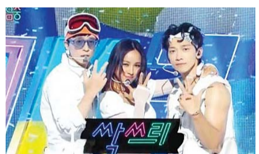
왼쪽부터 유재석, 이호리, 비.

지난해 MBC에 200억원 광고 수익을 벌여다 준 예능 ‘놀면 뭐하니?’ 짝쓰리 팀이 소외 아동을 위해 총 3억원을 기부하며 한 해 활동을 따뜻하게 마무리했다.