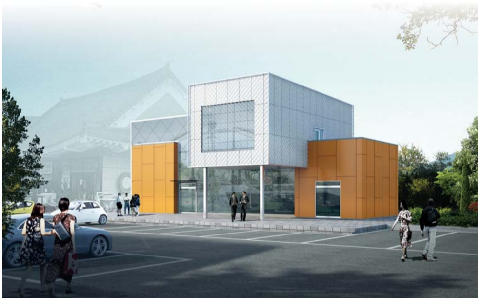
구례 섬진강 음식특화 마실장 투시도.