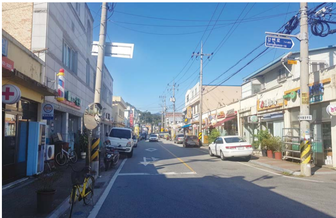
전남 최초로 시가지 골목형 상점가로 지정된 곡성군 석곡면 시가지.