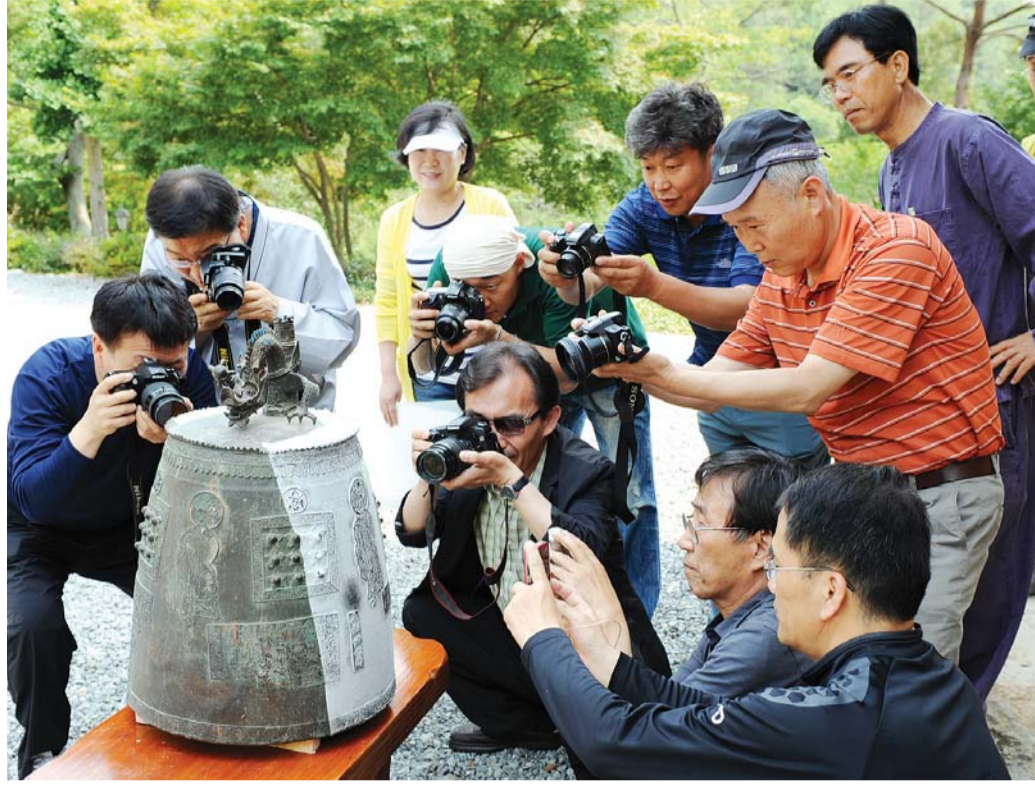
남도불교문화연구회 회원들이 장흥 신홍사 동종을 탁본하는 장면.