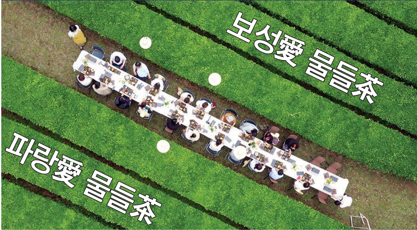
보성 찜물들차를 찾은 관광객들이 차밭에서 남도음식을 시식하고 있다.