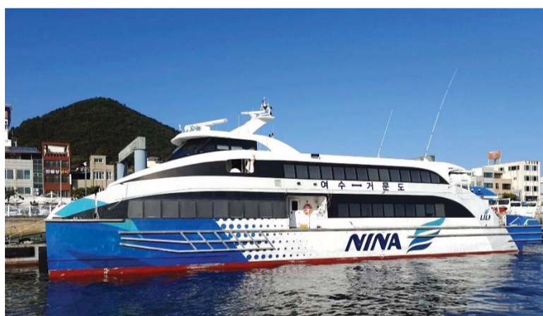
여수~거문도 항로 오갈 니나호.

찾은 결항으로 섬 주민들이 불편을 겪었던 여수~거문도 항로에 고속여객선이 취항한다.