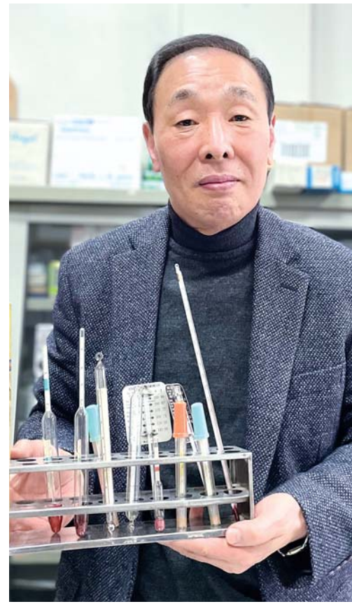
게를 이어가겠다”며 “좋은 아이템 개발해서 국내에 알리고, 공급하는 것이 목표이자 사명이다”고 말했다.