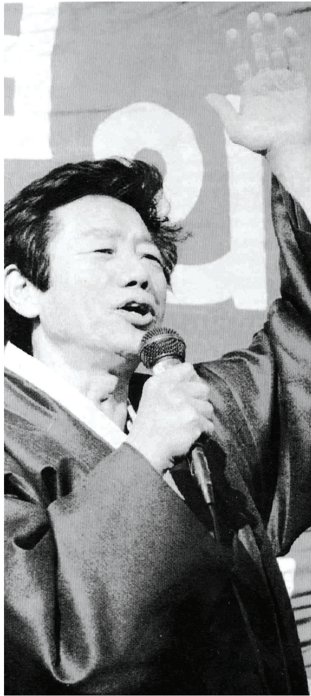
1992년 대선 후보로 출마한 백기완 선생이 제주에서 유세하고 있다.

한일협정·유신 반대 5·18과 동고동락 작은 옥고·고문 후유증 시달려 비정규직·용산참사 투쟁 등 늘 사회 약자편에서 싸워 작가·소설가로도 활동