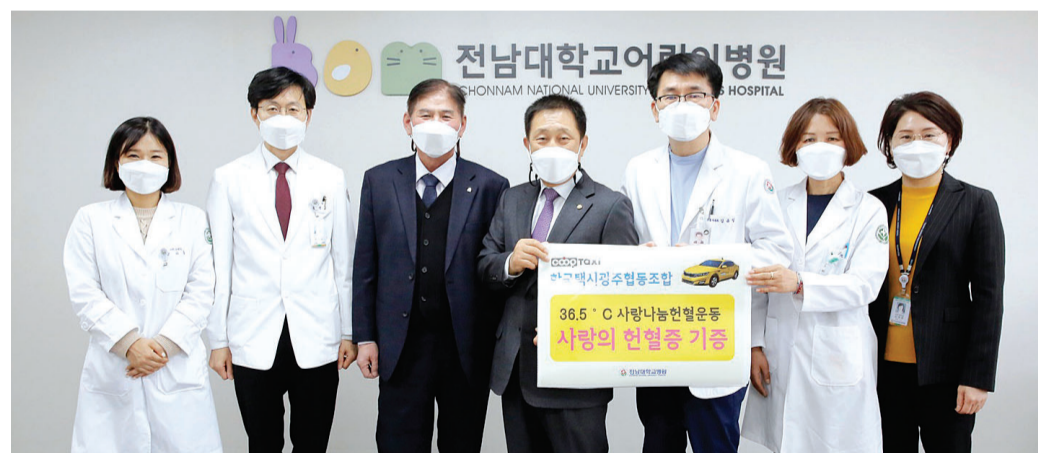
광주지역 택시업체인 한국택시광주협동조합(이사장 이상식)이 헌혈증서 60장을 17일 전남대학교병원(병원장 안영근)에 기증했다. 헌혈증서는 임직원들이 지난 3년간 생명나눔운동에 참여해 모았다.