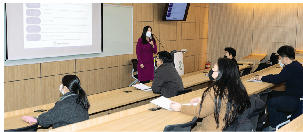
광주대학교(총장 김혁중) 미래자동차공학과는 최근 학교 행정관 스마트실에서 광주글로벌모터스 신입사원 채용 준비를 위한 취업프로그램 설명회를 개최했다. 이번 취업설명회는 광주·전남지역 지역혁신 플랫폼사업과 연계한 지역사회 청년 취·창업 프로그램의 일환으로 펼쳐졌다.