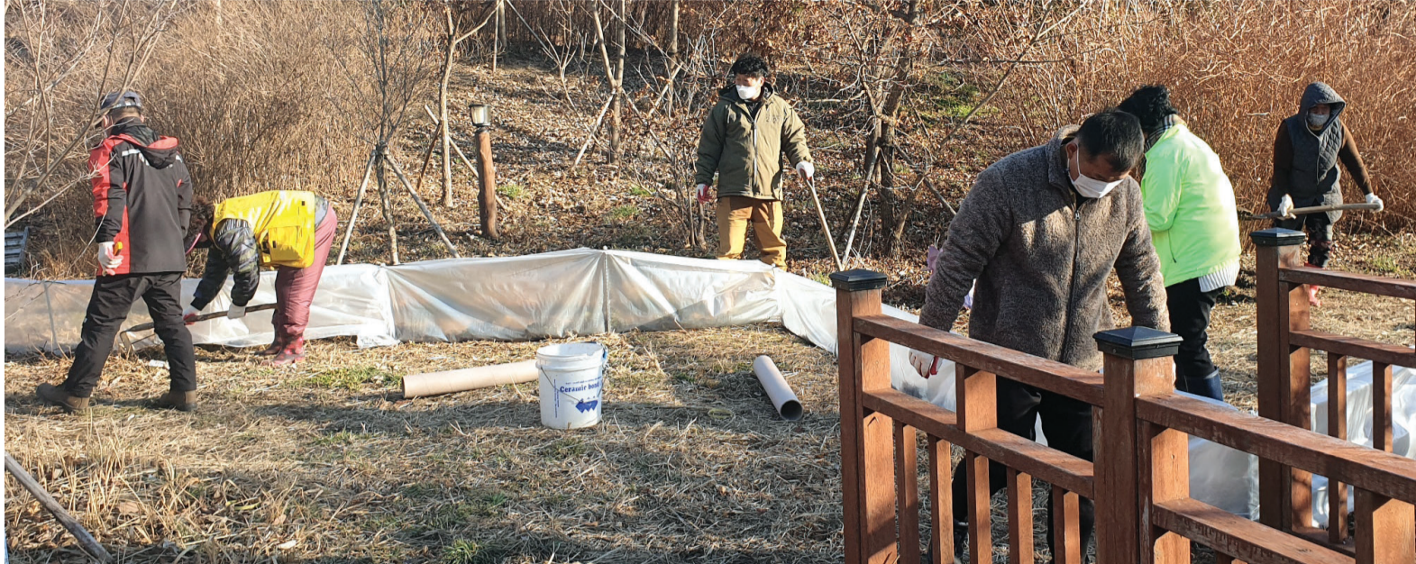
광양시 관계자 등이 지난 15일 비평저수지에 두꺼비 이동 유도 울타리를 설치하고 서식지와 산란지 보호활동을 하고 있다.

생태계 먹이사슬 중간자 역할 수생태계·대기 등 환경지표 동물 비촌 마을 앞 도로 로드킬 빈번 이달에만 400여 개체 희생 이동 유도 울타리 설치·홍보활동