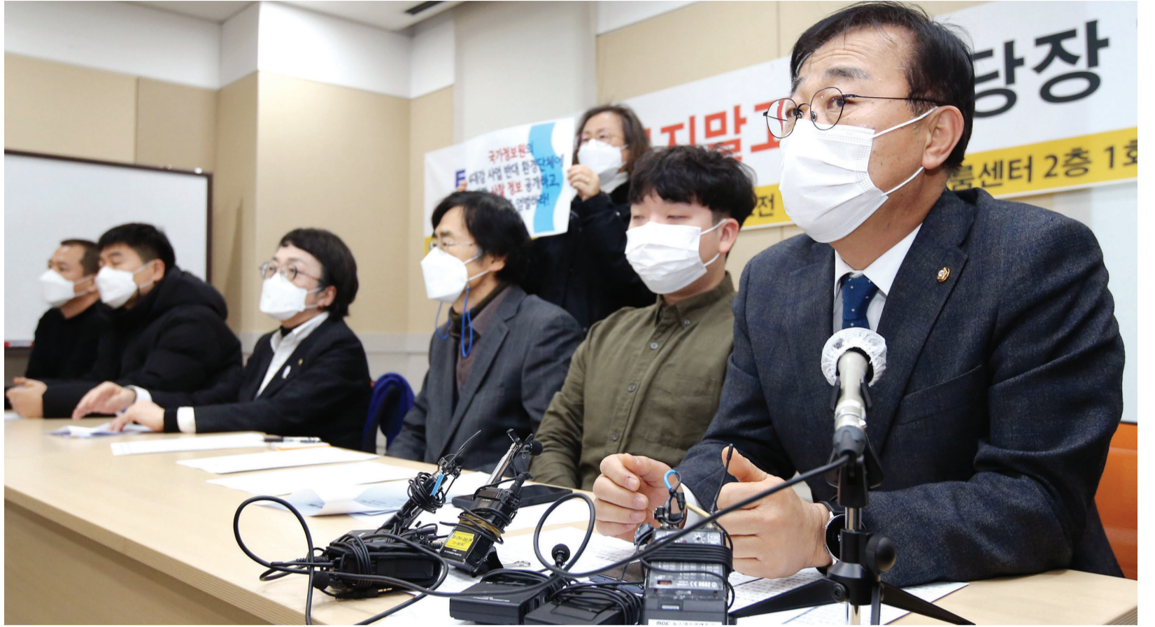
더불어민주당 김은덕 의원이 18일 오전 서울 여의도 이룸센터에서 열린 '국정원 불법사찰 진상규명, 사찰정보 전면공개, 재발방지, 사과 및 피해회복을 촉구하는 사찰피해자 기자회견'에서 발언을 하고 있다.