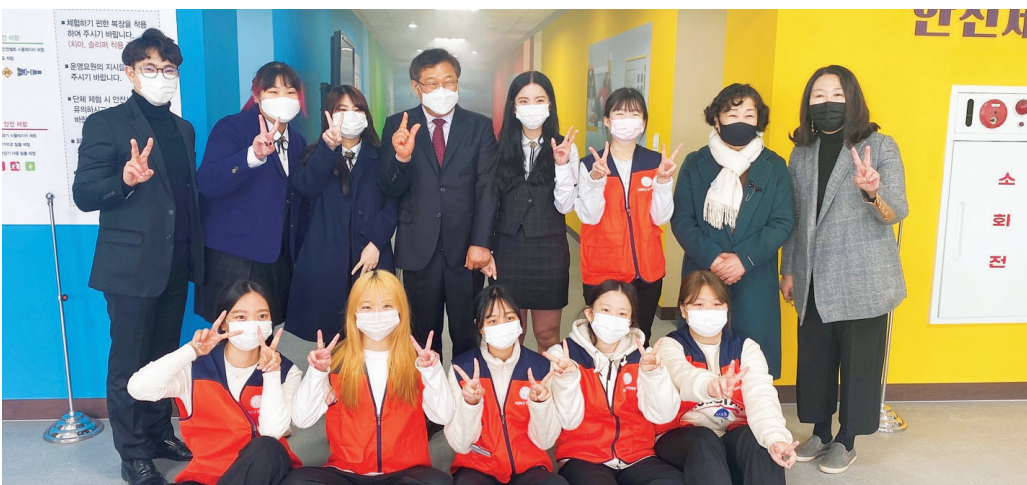
서진여고가 학생 및 교직원들을 위한 체험 중심의 교실형 안전체험관을 새롭게 구축해 개관했다. 신관에 구축된 안전체험관은 광주·전남에서 최초로 신설된 교실형 안전체험관이다. ▲교통안전체험 ▲재난안전체험 ▲응급처치체험 ▲화재안전체험 등으로 구성됐다.