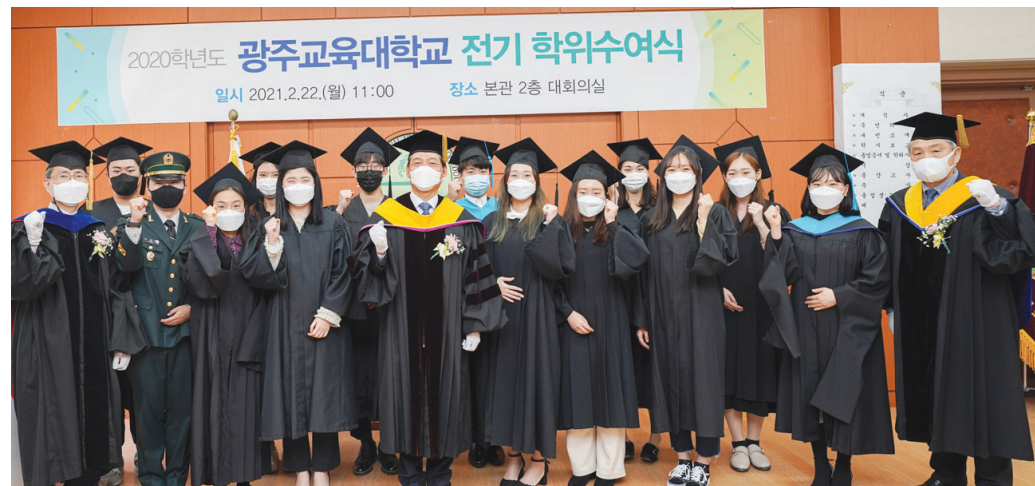
광주교육대학교는 22일 대학 대회의실에서 2020학년도 전기 학위수여식을 개최했다. 전기 학위수여 대상은 총 493명(대학원생 161명, 학부생 332명)이며, 코로나19 상황을 고려해 총장, 총동문회장, 내빈, 학과(전공)대표 등 최소 인원만 참석한 가운데 소규모로 치러졌다. /김대성 기자 bigkim@