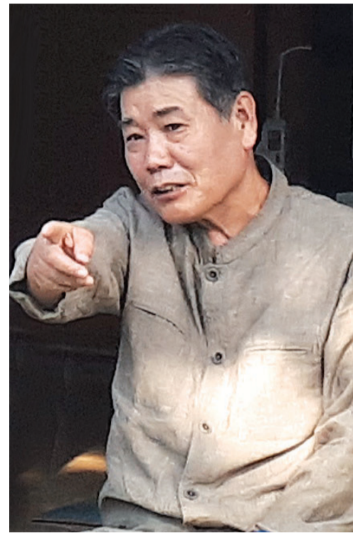
다. 앞으로도 역사와 불교를 고리로 남도와 남도인의 정체성을 드러내는 창작에 매진할 생각입니다.

“감사하게도 서울에서 내려온 이후 한해도 쉬지 않고 창작을 이어가고 있네요. 지금은 불교신문에 대하소설 ‘야소카대왕’을 연재하고 있습니