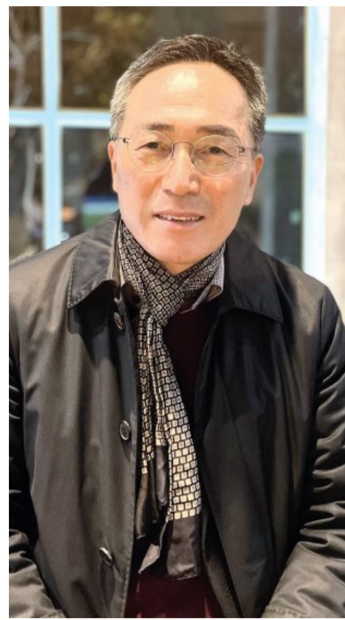
마지막 주 목요일에 진행된다.