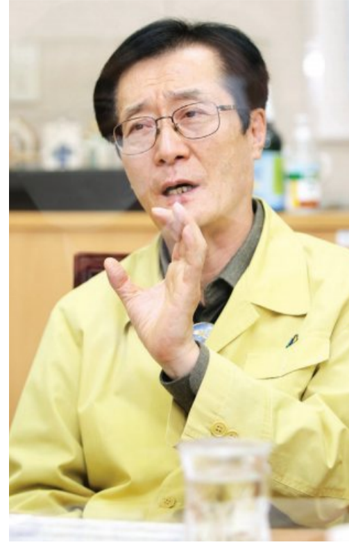
으로 섬의 자원과 자산을 디지털화 하는 ‘섬 데이터 댐’ 구축 사업을 정부에 제안한 것도 이런 자부심을 바탕으로 오랜 준비를 해온 결과로 보였다.