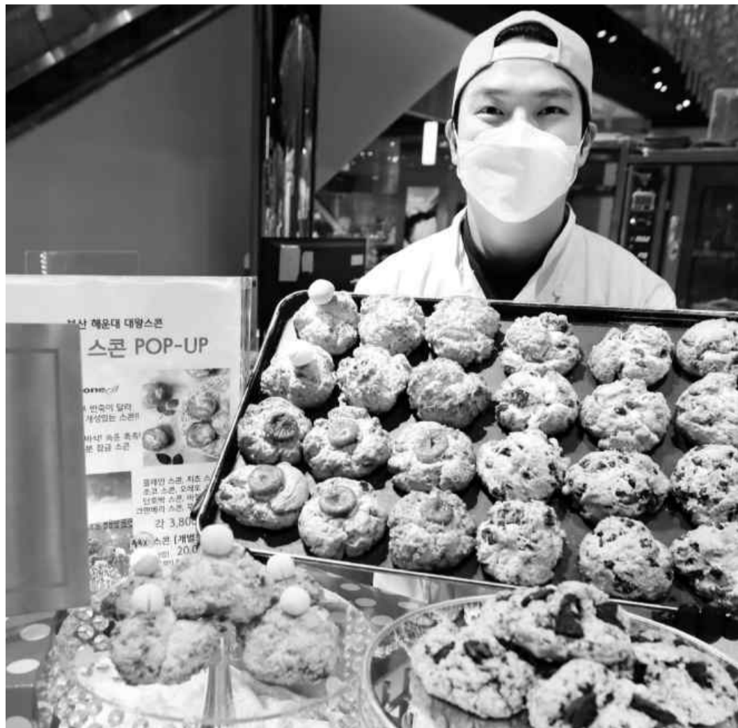
"달인 스콘 맛보세요" 롯데백화점 광주점 직원들이 15일 지하 1층 프리미엄 식품관에서 부산 해운대에 본점을 둔 '플라이 스콘' 제품들을 선보이고 있다. '스콘 달인'의 맛집으로 알려진 이 매장은 오는 25일까지 한시 운영된다.

전남도와 광주 광산구, 경남도, 경남 진주시·합천군 등 5개 자치단체는 잇따라 '제로페이 사용자에 대한 공공시설 이용료 등 경감 조례'를 시행하고 있다. /백희준 기자 bhj@kwangju.co.kr