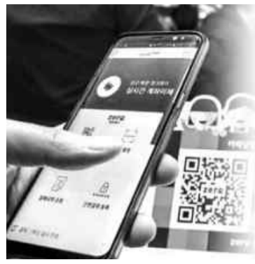
■제로페이 전국 가입률