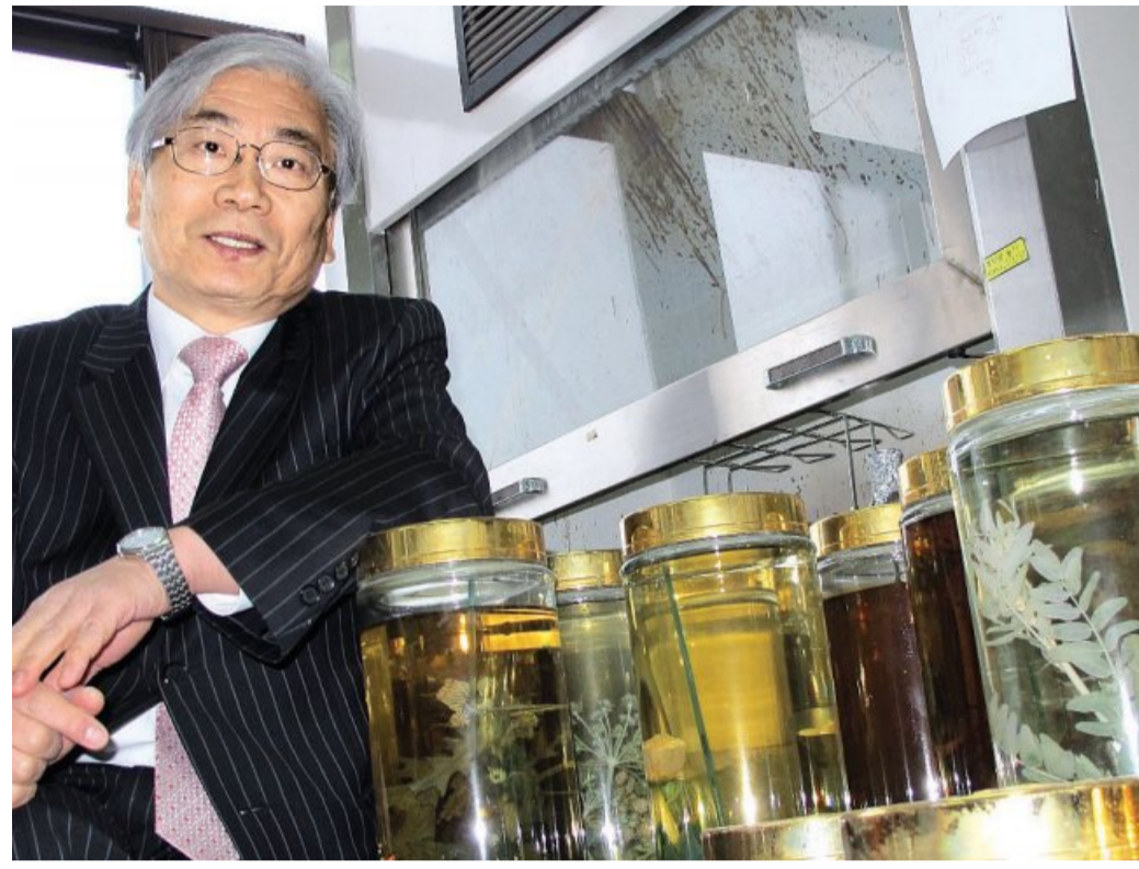
은 188종을 담았습니다.”

“동의보감에는 1400여종의 약초가 수록돼 있는데, 그 중 눈에 띄는 약초들이 있어요. 한자명뿐 아니라 한글로도 이름이 병기(併記)돼 있는 약초들이죠. 대추, 모과, 오미자 등인데, 실생활에서 백성들이 많이 썼던 약초가 아니었을까 추측합니다. ‘한글 약초’ 중 식약처 사용 승인을 받은 188종을 담았습니다.”