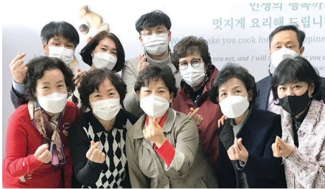
호남대 환경미화 담당 직원 등이 외식조리학과로부터 식사를 대접받은 뒤 교직원 등과 감사한 마음을 나누고 있다.