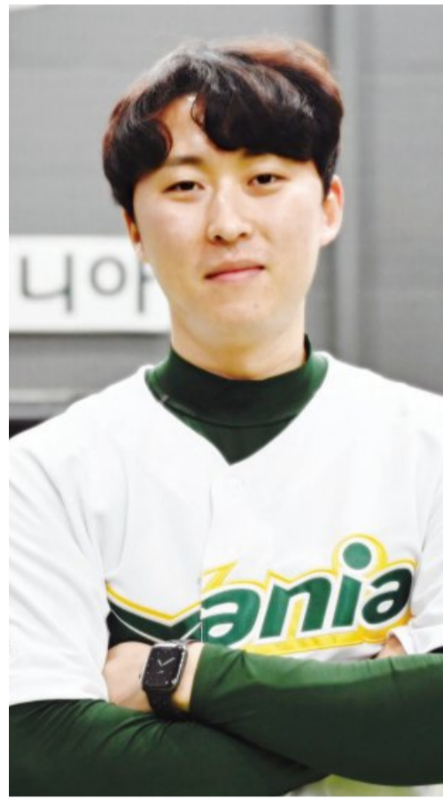
때 재활을 했던 선수가 아니라 한때 그레도 공 잘 던졌던 투수로 기억해주시면 좋겠다"고 웃었다.