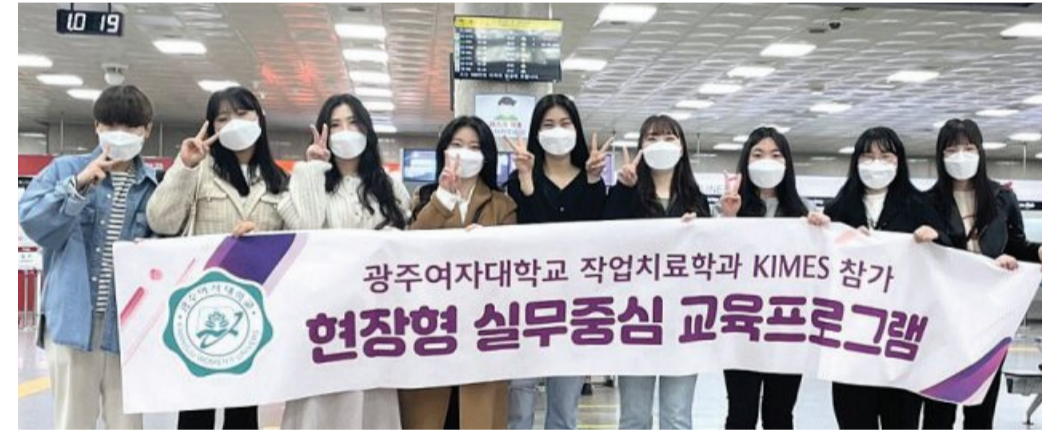
광주여자대학교(총장 이선재) 작업치료학과는 대학혁신지원사업 현장형 실무중심 교육프로그램의 하나로 최근 서울 COEX에서 개최된 국제의료기기전시회(KIMES)에 참여해 작업치료 분야에서의 다양한 장비와 도구, 시스템 등을 직접 관찰하고 체험했다.