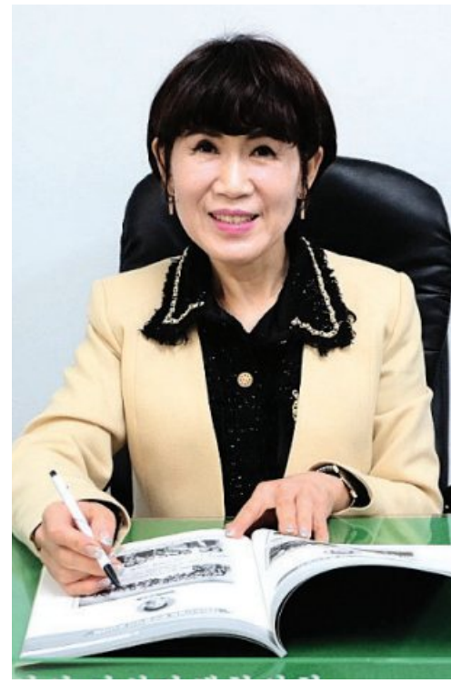
류 등을 진행 중이다.

한편, 1986년 창립한 광주여협은 금화여성회, 새마을부녀회, 대한어머니회, 한국여성유권자연맹 등 24개 단체의 소속 회원이 속한 광주여성들의 모임이다. 주요사업으로 평등사회구현사업, 도덕성 회복, 올바른 소비생활, 지역 여성 친선교