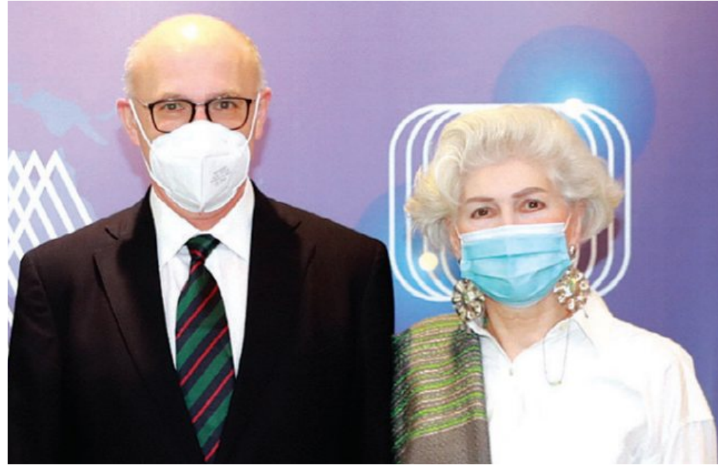
볼프강 양거출처(왼쪽) 주한 오스트리아 대사와 부인 수잔네 양거출처.

볼프강 양거출처 대사는 미안마 민주화운동을 위한 국제사회의 협조와 지지를 부탁하기도 했다. 이 시장은 “미안마 국민에 대한 학살과 인권유린은 1980년 5·18민주화운동과 아주 유사하게 진행되고 있다”며 “미안마 민주화운동이 세계인들에게 지지 받을 수 있도록 도와주시길 부탁드립니다”고 말했다.