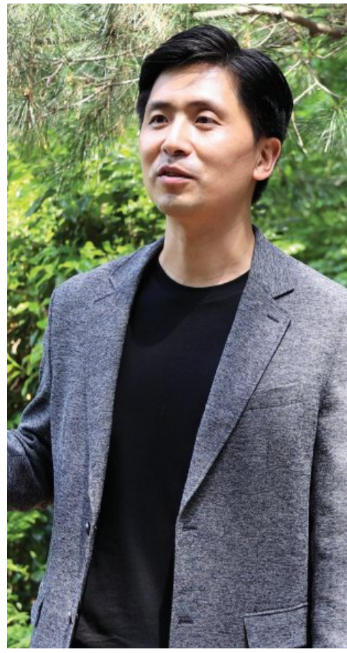
일자: 2021. 4. 2(금) 장소: 광주사회복지공동모금회 나눔문화관