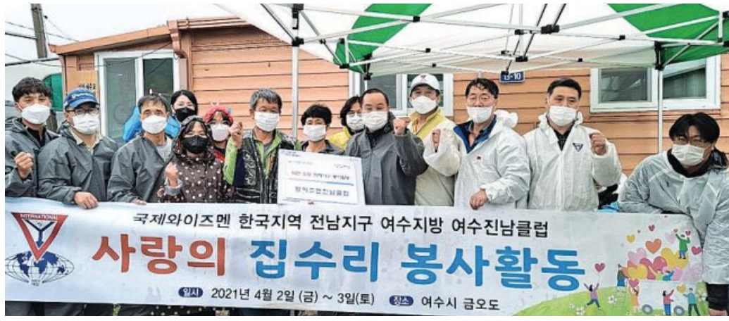
여수 지역민들로 구성된 봉사단이 여수 남면에서 집수리 봉사를 마치고 한자리에 모였다.