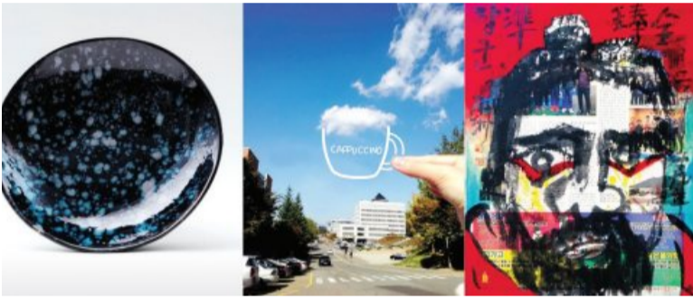
박종석 화백과 두 딸이 만든 도예·일러스트·회화 작품.