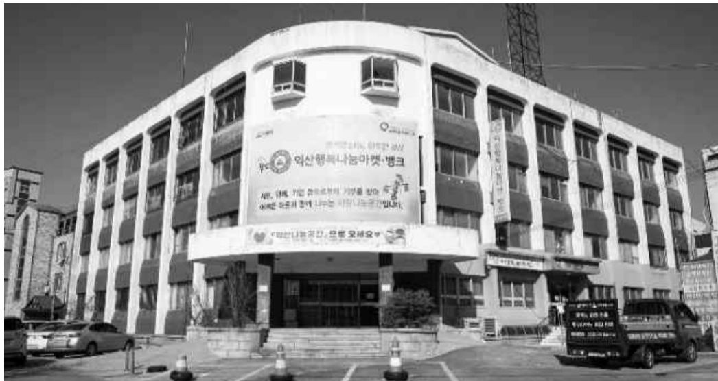
익산시가 운영하는 코로나19 극복 프로그램 ‘나눔 곳간’에 전국에서 기부 행렬이 이어지고 있다. 익산시 나눔 곳간 전경.

5만원 상당 식품·생필품 지원 두달간 5000명 넘게 이용 전국서 기부 행렬도 줄이어