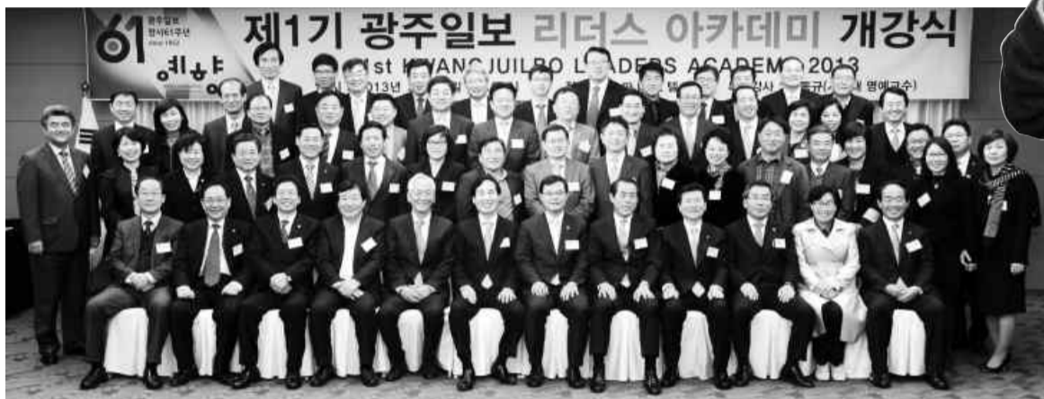
2013년 3월 열린 제1기 광주일보 리더스 아카데미 개강식.