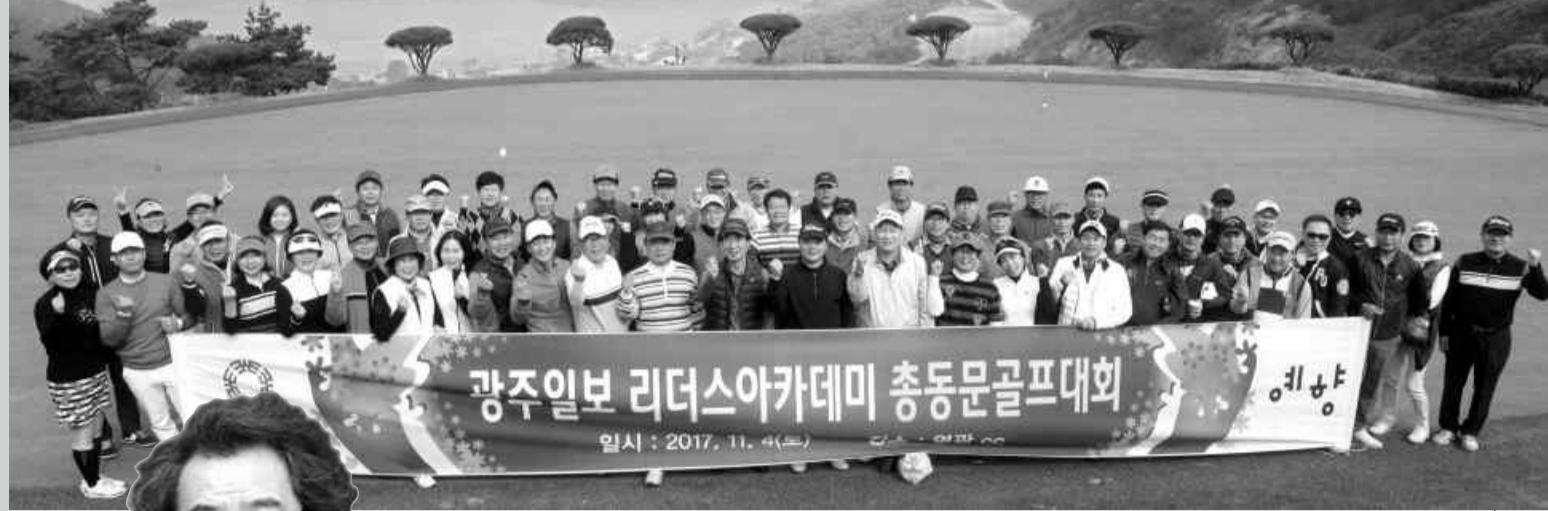
2017년 영광 컨트리클럽에서 열린 광주일보 리더스 아카데미 총동문골프대회.

2013년 1기부터 올해 9기까지 1100여 명 활동 각계 석학·유명 강사 대거 참여 수준 높은 강연의 장 법조 의료·교육·문화·예술계 전문가들 원우로 참여