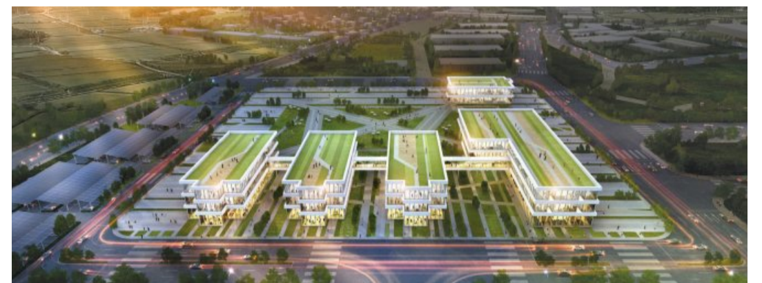
광주시가 2024년까지 4116억원을 투입해 조성하기로 한 인공지능(AI) 산업융합 집적단지 조감도. 광주 첨단3지구내에 3대 중심산업인 자동차·에너지·헬스케어 실증동(왼쪽 건물부터)과 창업지원동, AI 데이터센터(오른쪽 두)가 건립된다.

손경중 광주시 인공지능산업공장은 "친환경과 자율주행 중심의 미래형 자동차산업은 인공지능산업과 함께 광주가 4차 산업혁명시대의 주력 산업으로 집중 육성하고 있는 분야"라면서 "빛그린산단은 부품·인증·완성차공장에 이르는 일관체계가 구축