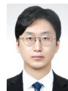
강진전에 기여할 수 있도록 노력하겠다”고 수상소감을 밝혔다.

이 연구 결과를 근거로 확진자가 자주 접촉하는 물품 및 싱크대와 같이 습기가 많은 장소의 철저한