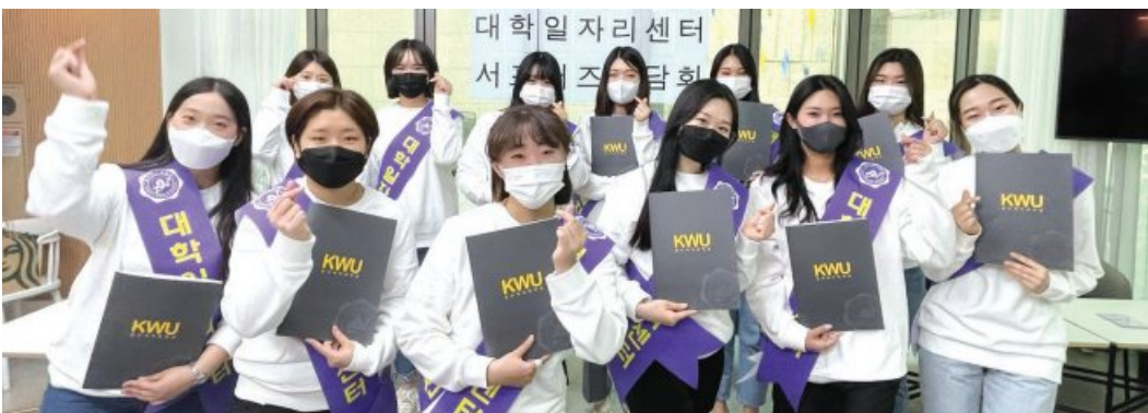
광주여자대학교(총장 이선재) 대학일자리센터는 최근 '3UP STATION' 세미나실에서 대학일자리센터 서포터즈(12명) 간담회를 가졌다. 이날 간담회에서는 대학일자리센터 사업 및 청년고용정책에 대해 홍보하고, 2020년 대학일자리 서포터즈 선배들의 SNS 홍보전략 공유의 시간을 가졌다.