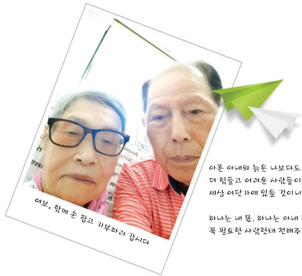
아픈 아내와 늙은 나보다도 더 힘들고 어려운 사람들이 세상 어딘가에 있을 것이니 하나는 내 몫, 하나는 아내 몫 꼭 필요한 사람한테 전해줄길